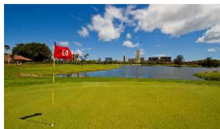
ホノルルカントリークラブ(ハワイ)