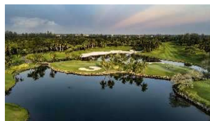
アルパインゴルフクラブ(タイ)