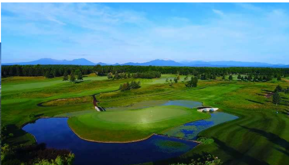
ザ・ノースカントリーゴルフクラブ