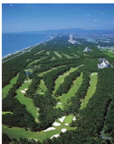
フェニックスカントリークラブ