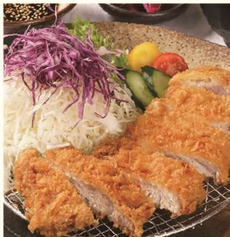
樽前湧水豚ロースカツ御膳