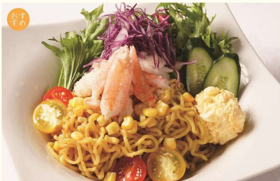
ズワイ蟹のラーメンサラダ ¥1,700