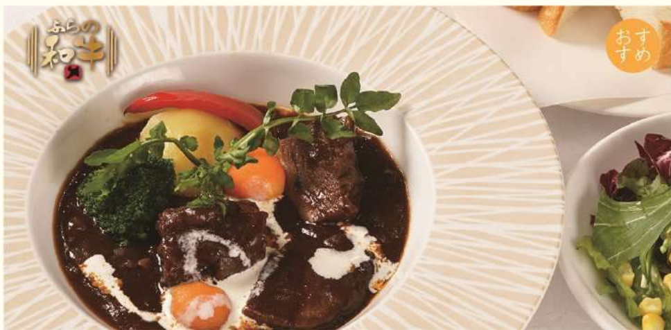
ふらの和牛ビーフシチューセット ¥ 2,950