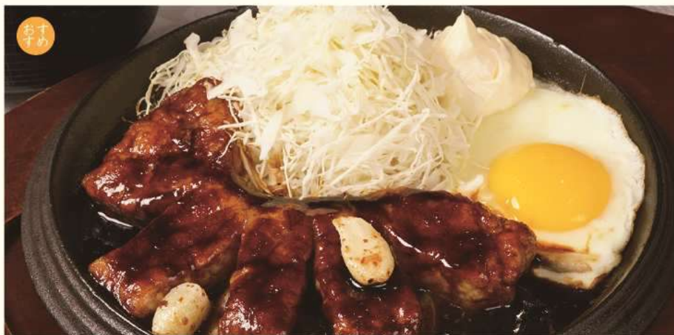
樽前湧水豚トンテキ御膳 ¥ 1,600