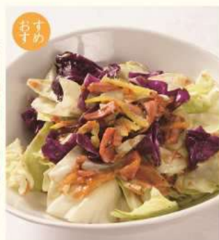
イカチョビ塩キャベツ ¥750