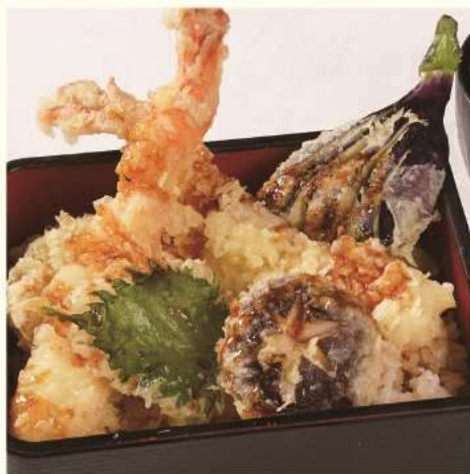
海老野菜天重 Shrimp Tempura Don 味噌汁・漬物 w/Miso soup and pickles