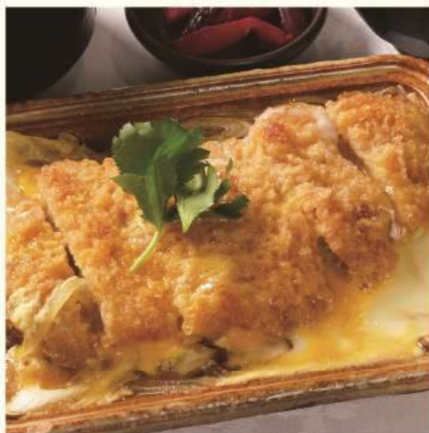
樽前豚カツとじ御膳