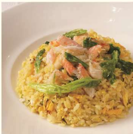
蟹とレタスのチャーハン