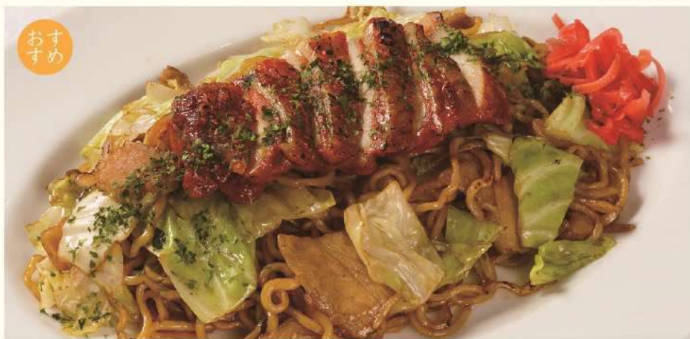
バーディ焼きそば Birdie Yakisoba