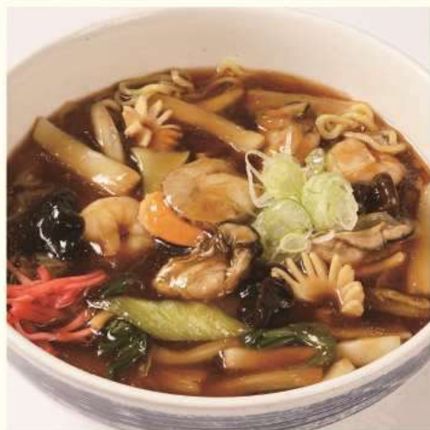
広東麺 ¥1,500 Ramen with Seafood