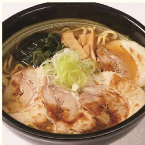
特製札幌味噌ラーメン ¥1,350 Miso Ramen