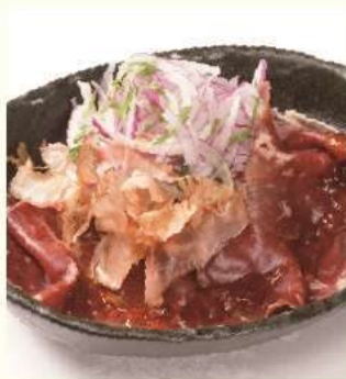
ラム生ハムと オニオンライス ¥1,050