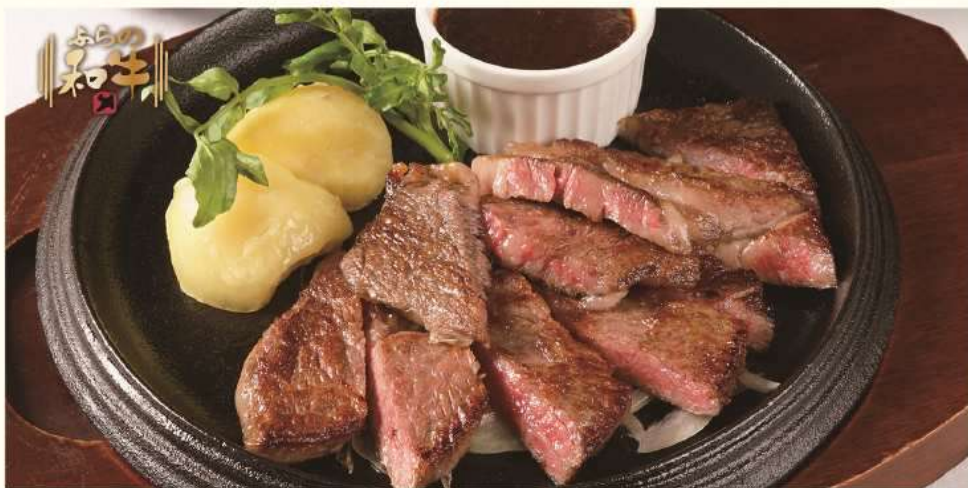
ふらの和牛サーロインステーキ御膳 ¥ 4,800