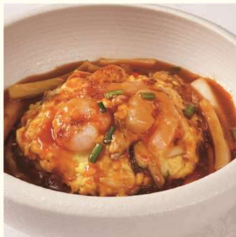
辛辛卵飯 (ピリ辛天津飯)