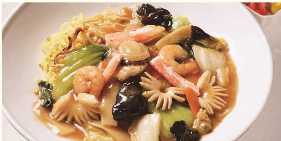
海鮮あんかけ焼きそば Fried Noodles with Seafood Sauce