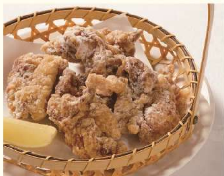
伊達産鶏の唐揚げ