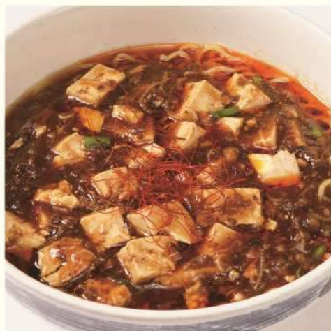
麻婆ラーメン (ライス付き) ¥1,450 Mapo Ramen