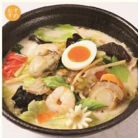
ノースちゃんぽん麺 ¥1,500 Chanpon Noodles