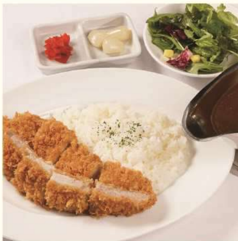
樽前湧水豚ロースカツカレー