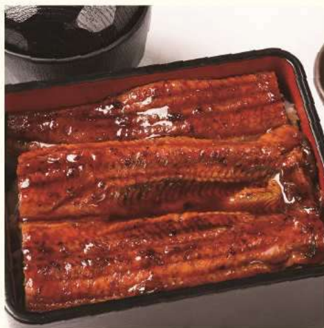
うな重御膳 Una Don(Eel Don)set 味噌汁・漬物・小鉢 w/Miso soup, pickles