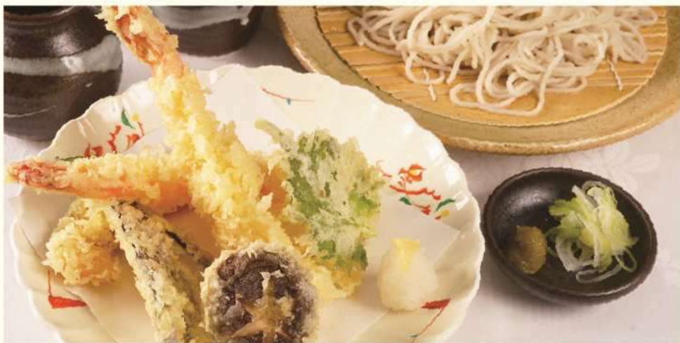
天ざる蕎麦 ※うどんに変更できます。 Tempura and Soba