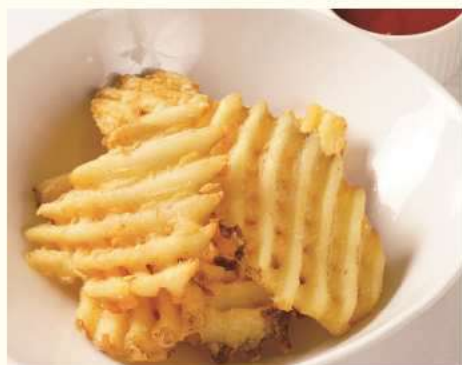
ワッフルカットポテト