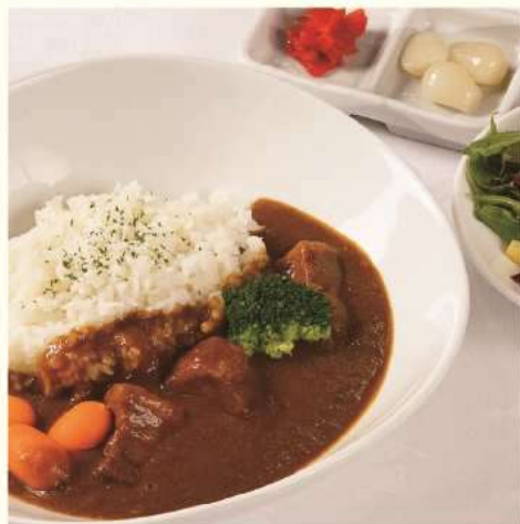
樽前湧水豚ポークカレーライス