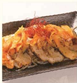
ピリ辛炙り 葱チャーシュー ¥950